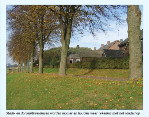
Stads- en dorpsuitbreidingen worden mooier en houden meer rekening met het landschap

Verder is de visie een basis voor concrete projecten in de omgeving waarbij alle gebruikers van het gebied betrokken zijn. Mensen kunnen met deze plannen aan de slag. Het is een inspiratiebron voor iedereen die geïnteresseerd is in de waarden van het gebied.