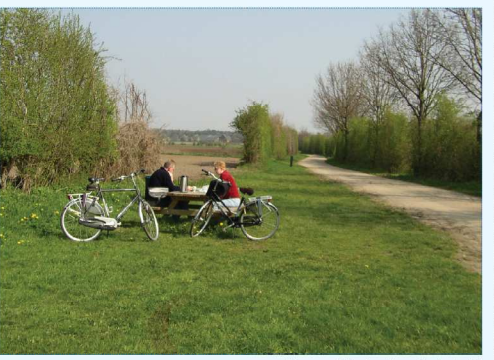
Het recreatief netwerk wordt uitgebreid

Begrenzing van het gebied De begrenzing van het gebied noordelijke Maasvallei is op de visiekaart aan de achterkant van deze folder weergegeven. Het gaat globaal om de gemeenten Cuijk en Boxmeer oostelijk van de Rijksweg A73 en de gemeenten Mook en Middelaar, Gennep en Bergen westelijk van de provinciale weg N371. Het Maasheggenlandschap is een belangrijk onderdeel van het gebied, maar ook andere landschappen komen in dit gebied voor (bijvoorbeeld de open akkers, de dorpen en dorpsranden et cetera). Cultuurhistorische waarden en ruimtelijke ontwikkelingen Onder cultuurhistorische waarden verstaan we die zaken die iedereen wel kent: vestingwerken); bouwkundige waarden en stedenbouwkundige structuren (zoals boerderijen en archeologisch waardevolle gebieden en elementen (zoals de Romeinse opgravingen); historische landschappen (zoals het Maasheggenlandschap). Belangrijke waarden, die herinneren aan een verleden dat de Maasvallei heeft gemaakt tot een uniek en waardevol stuk van Nederland. Maar de Maasvallei is ook een gebied als alle andere: mensen wonen en werken er, ze gaan er op vakantie, maken een fietstocht of een wandeling, verbouwen gewassen en houden vee. Allemaal activiteiten waarvoor ruimte nodig is. De kunst is om bij deze ruimtelijke ontwikkelingen rekening te houden met de cultuurhistorie. Dat betekent niet per se dat cultuurhistorie de ontwikkelingen tegenhoudt, maar dat er wellicht oplossingen zijn om het één te behouden zonder het andere te laten.